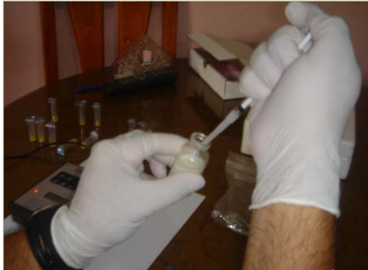
Toma de muestra de leche