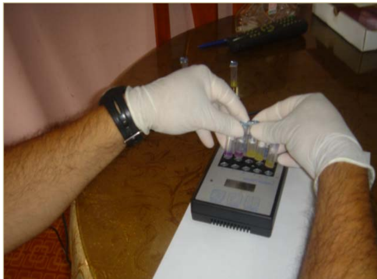
Toma de resultados de kit Delvotest