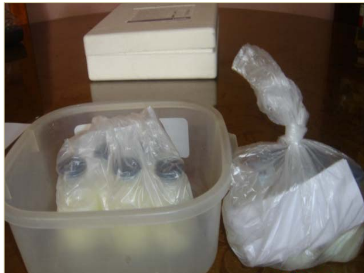
Muestras de leche tratada con Cefa Milk Forte