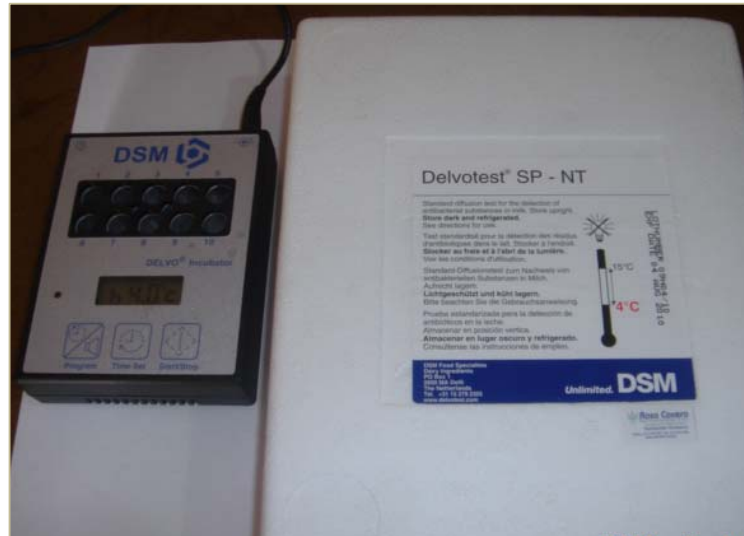
Kit completo Delvotest