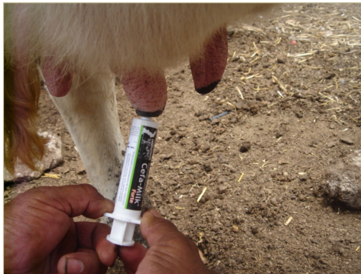
Aplicación de Cefa Milk® Forte