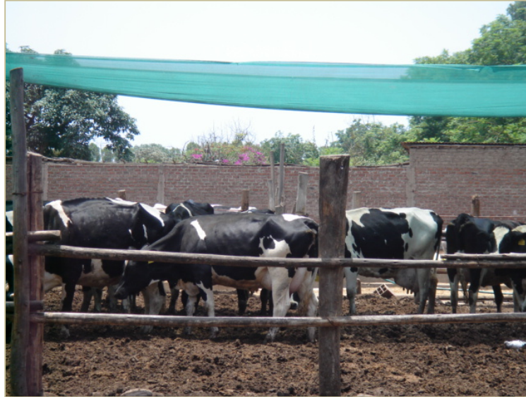
Vacas lecheras previas a la evaluación