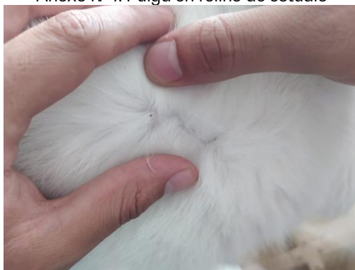
Anexo N°3. Pulgas muertas en el ambiente 2 horas post-aplicación